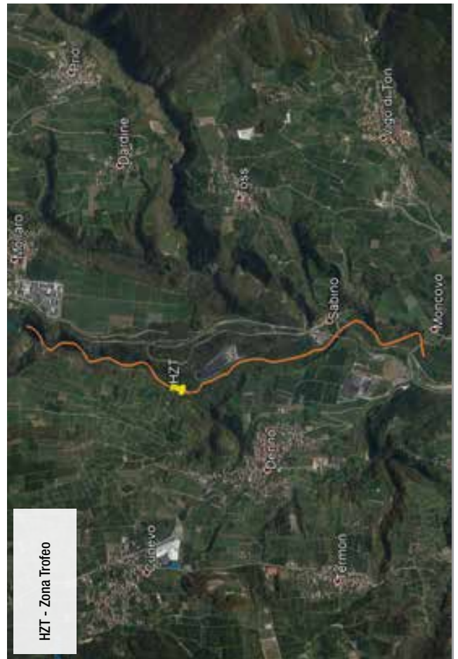
FIGURA 4: TORRENTE NOCE "HZT" - Da 100 m a valle del ponte di Moncovo fino allo sbarramento della diga di Mollaro.