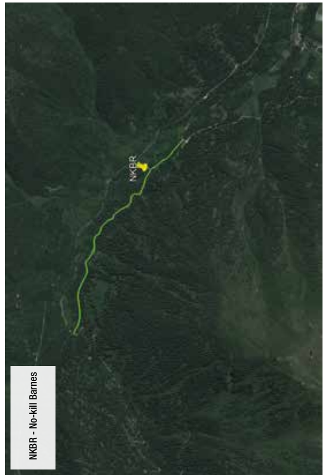
FIGURA 2: TORRENTE BARNES ZONA NO-KILL - Dal ponte Poie al ponte Amol