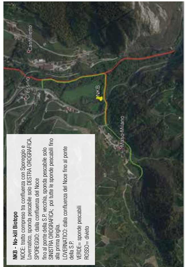
FIGURA 6: TORRENTE NOCE "NKB"