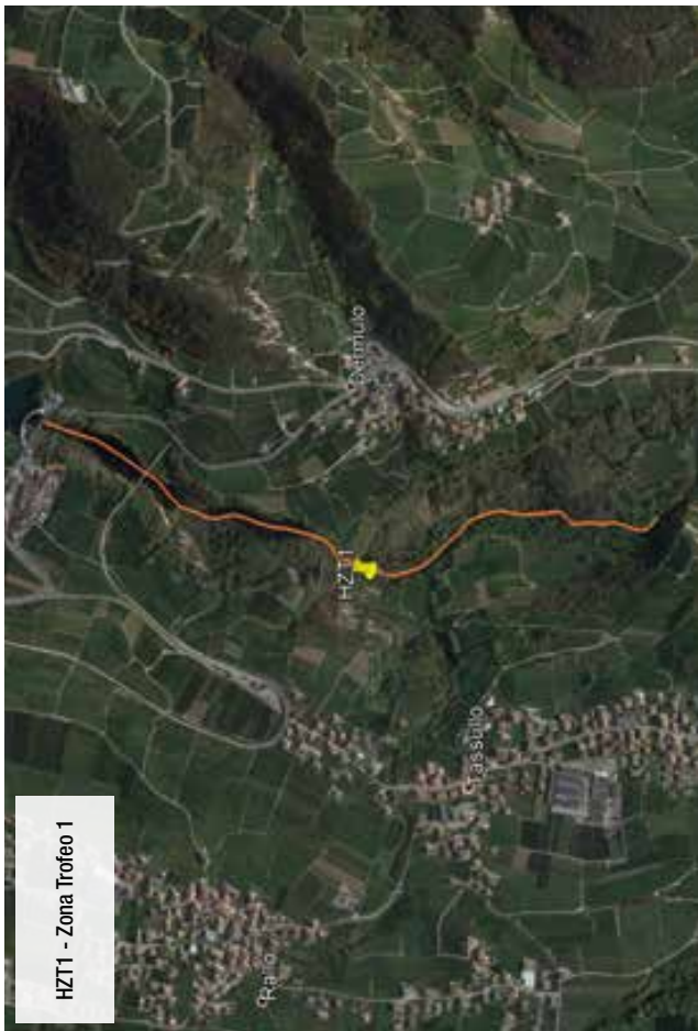
FIGURA 5: TORRENTE NOCE "H2T1" - Dallo sperone di roccia di fronte alla campagna di Dermulo alla diga di S. Giustina.