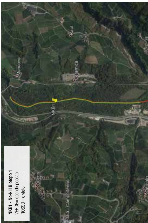
FIGURA 7: TORRENTE NOCE "NKB1" - Dalla cava Fiumeter fino a 100 m a valle del ponte di Mocovo, sponda pescabile solo DESTRA OROGRAFICA.