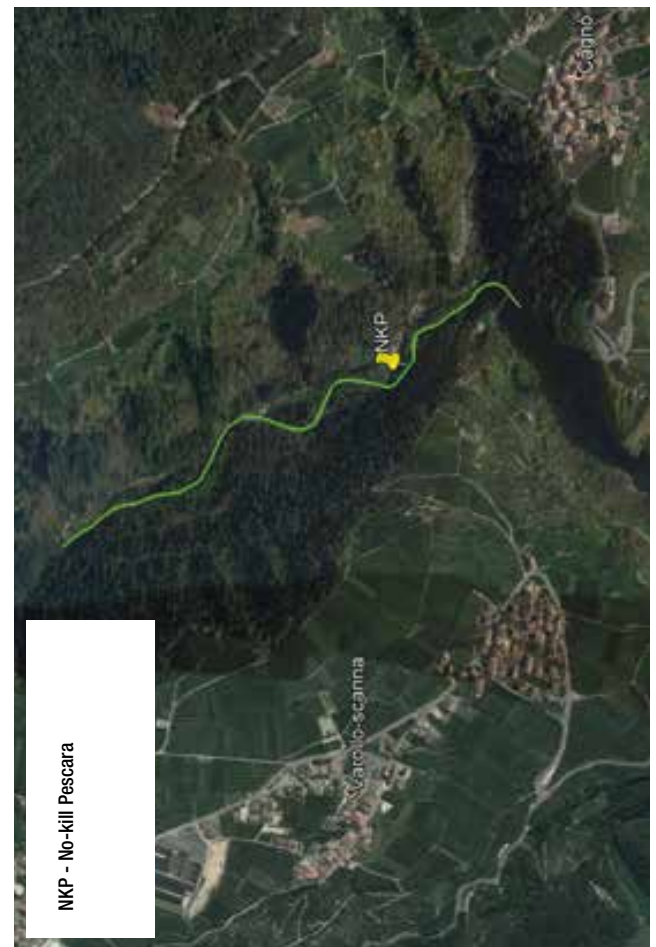
FIGURA 8: TORRENTE NOCE "NKP" - Dalla foce nel Lago di S. Giustina alla presa della nuova centralina.