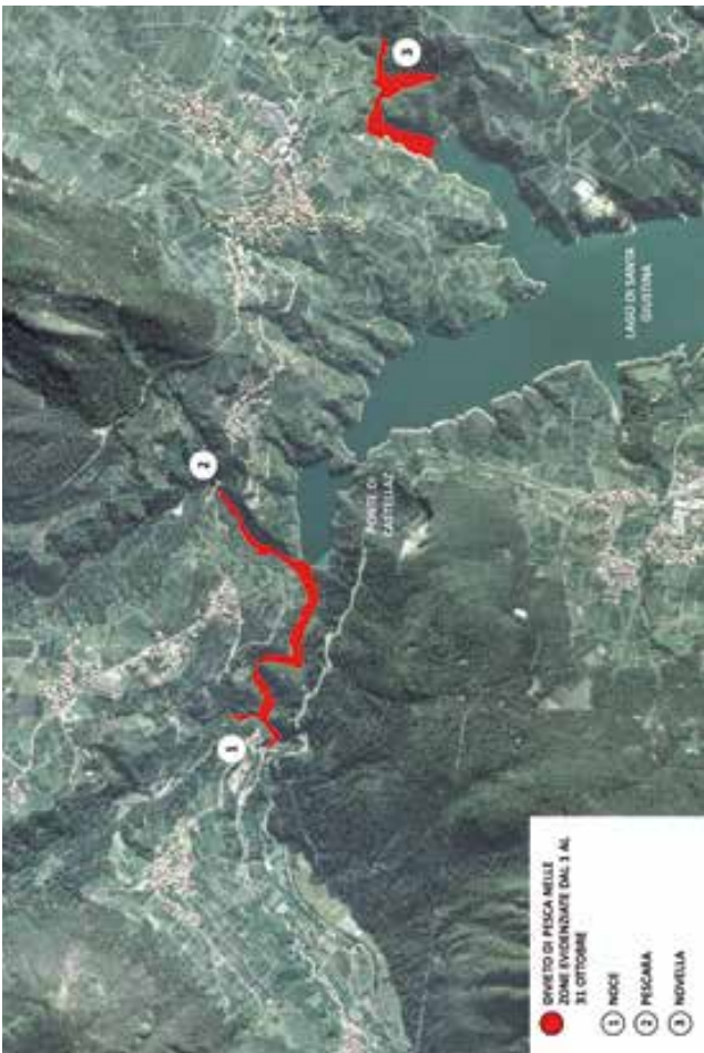
FIGURA 1: LAGO DI SANTA GIUSTINA